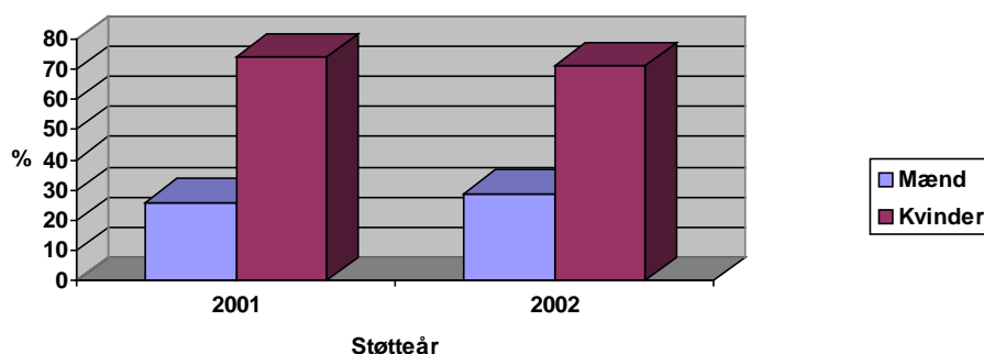
Figur 2 Kønfordeling 2001 - 2002

For de videregående uddannelser er andelen af kvinder 78 procent. Kvindeandelen varierer en del mellem uddannelsesstyperne.